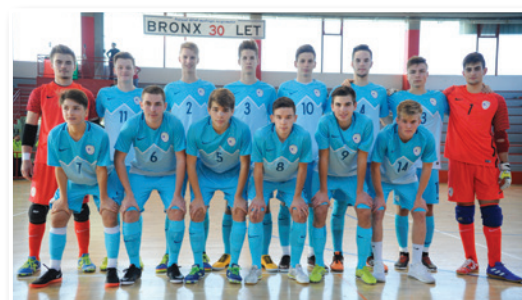
Reprezentanca do 17 let