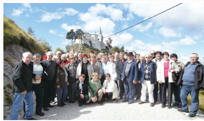
Na Sveti gori v Zasavju