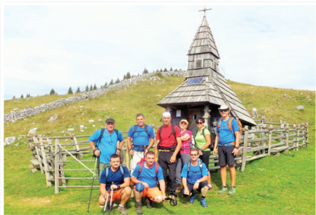
Start na Biba planini (1308 m)