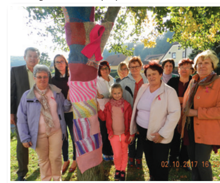
Rožnate pletenine v Jurovskem Dolu

tekala 2. 10. 2017, je ozaveščanje o raku dojke, pomenu preventivnega samopregledovanja in zdravega načina življenja.