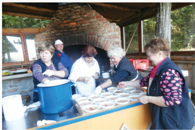
Druženje na kmetiji Postružnik

deželja ob Dravi in v Slovenskih goricah. Čas izgradnje sega v leto 1854. Notranjost je opremljena s številnimi avtentičnimi predmeti. Razglašena je za etnološki spomenik lokalnega pomena. Upravljalca domačije je Turistično