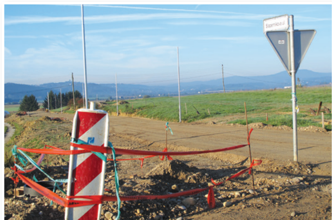
Ulica Rajka Slapernika v nastajajočem naselju Trojica Jug je že zgrajena. Po njej je brez problemov možen dostop do gradbenih parcel z avtomobili, tovornjaki in gradbeno mehanizacijo.