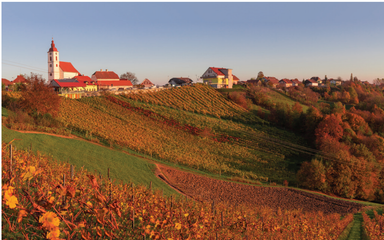
Sveta Ana se je odela v jesenske barve ...