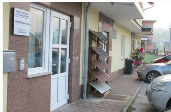
Zdravstvena ambulanta v Benediktu