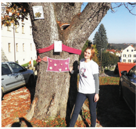
Rožnate pletenine 17. oktobra v Sv. Trojici

V zadnjih dneh je precej zanimanja in vprašanj vzbudil v rožnate pletenine oviti divji kostanj, ki stoji ob OŠ in vrtcu, ob poti v trško jedro in k znameniti cerkvi in samostanu Sv. Trojica. Brez skrbi, drevo se ni »prehladilo«, pač pa je tudi Občina Sveta Trojica v Slovenskih goricah vključena v akcijo Rožnate pletenine.