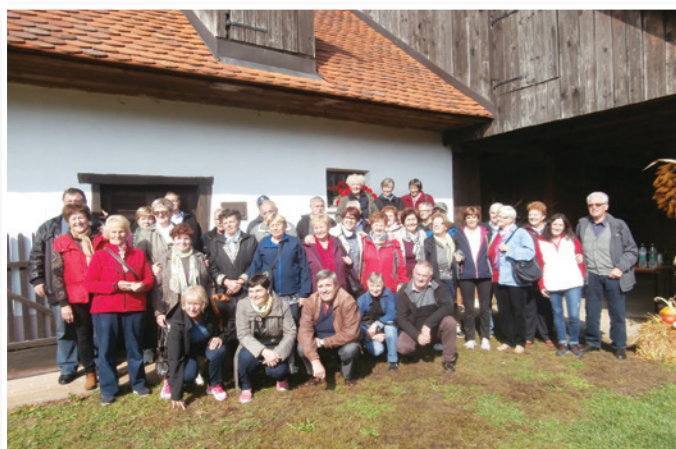
Na Čušekovi domačiji v Dornavi

Naslednja aktivnost društva je potekala 10. oktobra 2017, ko smo se družili s pobratanim DU Rogoznica po njihovem programu. TA Leze nas je popeljala do Čušekove domačije, ki je bila obnovljena v sklopu LAS Bogastvo po-