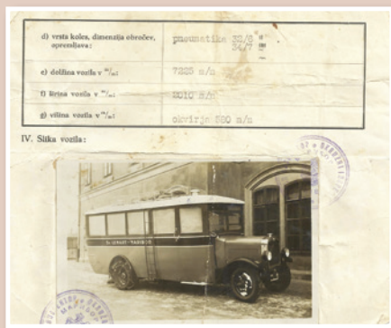
Avtobus 1932. leta