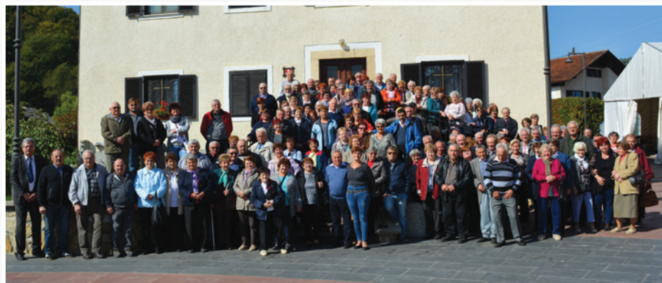
Srečanje je poteklo ob domači hrani, dobri kapljici in prijetni glasbi.