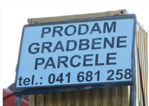
Zanimanje za gradbene parcele v novem naselju je vse večje.

videti, kako na travniku raste novo naselje, v katerem bo 60 hiš.